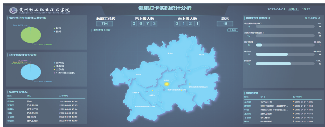
健康打卡实时统计分析。